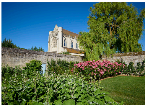
Abbatiale de l'abbaye d'Ardenne.

L'Institut Mémoires de l'édition contemporaine (IMEC), préserve et met en valeur une collection exceptionnelle d'archives dédiée à l'histoire de la pensée et de la création contemporaine. Depuis sa fondation, l'IMEC contribue au rayonnement de la recherche sur la vie littéraire, éditoriale, artistique et intellectuelle. Dans ce cadre, l'IMEC souhaite renforcer sa politique de coopération professionnelle et scientifique avec le monde de la recherche, et en particulier auprès des jeunes chercheurs.