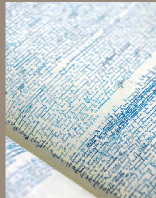
Suite française, fonds Irène Némirovsky / IMEC

Confiées par des auteurs ou des ayants droit, des maisons d'édition ou des associations culturelles, les archives sont préservées dans leur intégrité matérielle et leur cohérence intellectuelle, et font l'objet d'un traitement archivistique spécifique. Par le croisement de ses fonds et de ses collections (archives d'auteurs et de créateurs, de maisons d'édition, bibliothèques d'études, collections de revues), l'IMEC reconstitue, entre éditions, écriture, arts et pensée, les réseaux qui composent le tissu de la vie culturelle, et ouvre de nouvelles perspectives à la recherche.